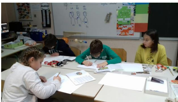
Slika 17: Načrtujemo turistične spominke v podobi hroščka Simona

Družili smo se ob četrtnih, bili smo delavni in ustvarjalni.