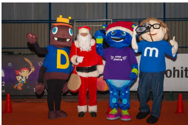
Slika 14: https://otok-sporta.si/programi/3-dobrodelni-bozickov-tek-pohod-fotogalerija/bozickov-tek-in-pohod-domzale-1/