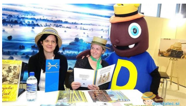
Slika 6: http://domzalec.si/na-turisticnem-sejmu-natour-alpe-adria-tudi-obcina-domzale/

Vsako leto se hrošček Simon odpravi na turistični sejem Natour Alpe Adria, na Gospodarsko razstavišče v Ljubljani, kjer se predstavi tudi občina Domžale. Tam razveseljuje mlajše in starejše obiskovalce, ki jih povabi v mesto Domžale po Plečnikovi poti, po poti slarnikarskih tovarn, ogledov muzejev in galerij, ogledov aktualnih dogodkov kot so pustna povorka na Viru, Slarnikarski sejem, Poletni kulturni festival na Studencu, Hroščkov festival vse do rekreacije, pohodov, ogledov znamenitosti mesta Domžal.