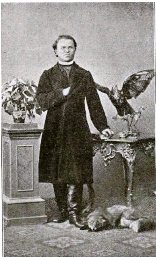
Prirodoslovec. (S. Robič.)