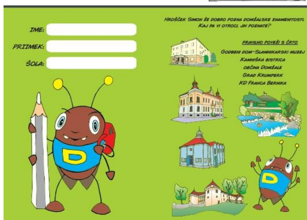
Slika 8: Ilustratorka Marta Bartolj

Hrošček Simon se odpravi na obisk vrtcev in šol v občini Domžal, kjer skupaj s policisti in podžupanjo, ozaveščajo o varnosti v cestnem prometu. Otroci prejmejo pobarvanko »Varno na poti«, v kateri otroke uči, kako varno prečkati cesto in prehod čez železniško progo, kako upoštevati prometna pravila, poznati prometne znake, biti viden in varen v prometu.