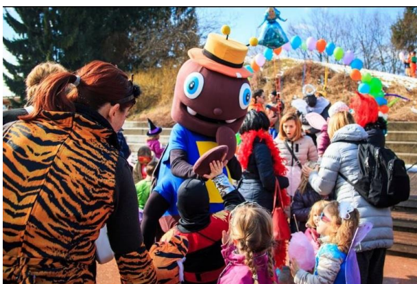
Slika 7:

V času pusta vas hrošček Simon vabi na Otroško pustno rajanje v Češminov park v Domžalah. Zimo bomo skupaj pregnali in se s krofi posladkali. Rajanju se hroščku Simonu pridružijo kurenti iz Ormoža. Vabljeni tudi v Pustno deželo Vir, kjer zmaga najboljša maska Domžal. Na povorki ti zaigra tudi domžalska godba.