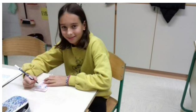
Slika 18: Imam super idejo za izdelavo turističnega spominka