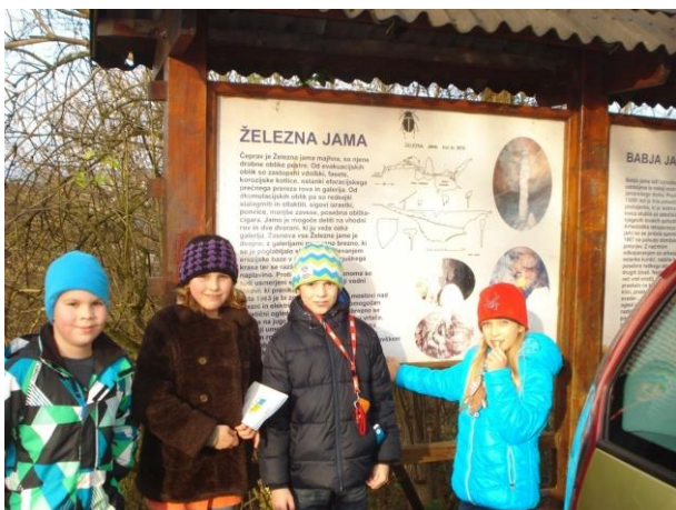
Slika 1: Raziskovalci pred Železno jamo