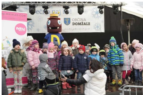
Slika 16: http://www.visitdomzale.si/dogodek/otrosko-silvestrovanje-1

Meseca decembra se vrstijo različni dogodki, ki so zelo pomembni za najmlajše občane našega mesta. Hrošček Simon se pojavlja na Miklavževanju v športni dvorani Domžale, na Božičkovem dobrodelnem teku in pohodu v športnem parku v Domžale, ob prihodu Božička v Češminovem parku ter na otroškem silvestrovanju prav tako v Češminovem parku.