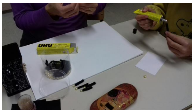
Slika 20: Učenci izdelujejo turistični spominek (najprej je nastala hroščkova tipalka)