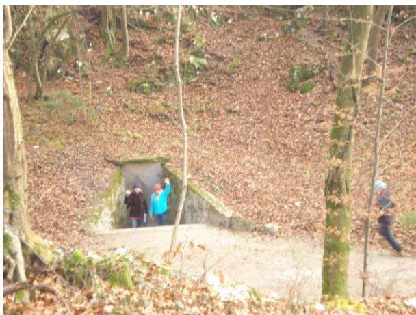
Slika 2: Vhod v Železno jamo