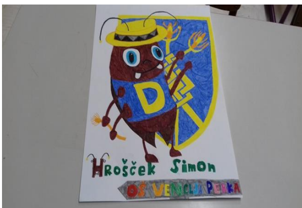
Slika 19: Takole je po podobi maskote hroščka Simona narisal Jaka