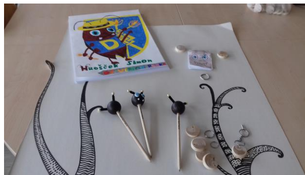
Slika 22: Izdelki za predstavitev na turistični tržnici