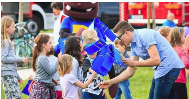
Slika 9: http://domzalec.si/program-prireditve-spoznajmo-se-praznujmo-skupaj/

19. aprila počastimo občinski »rojstni dan«, kjer se spoznavamo, družimo in zabavamo. Na prireditvi je aktiven tudi hrošček Simon. Prireditev "Spoznajmo se, praznujmo skupaj" se odvija v Češminovem parku. Vsako leto z bogatim programom vabi tako stare kot mlade. Praznovanja se udeležijo tudi učenci OŠ Venclja Perka. Na stojnici predstavljamo našo vsakoletno turistično nalogo in organiziramo delavnice za obiskovalce.