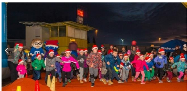
Slika 15: https://otok-sporta.si/programi/bozickov-tek/

Meseca decembra se vrstijo različni dogodki, ki so zelo pomembni za najmlajše občane našega mesta. Hrošček Simon se pojavlja na Miklavževanju v športni dvorani Domžale, na Božičkovem dobrodelnem teku in pohodu v športnem parku v Domžale, ob prihodu Božička v Češminovem parku ter na otroškem silvestrovanju prav tako v Češminovem parku.