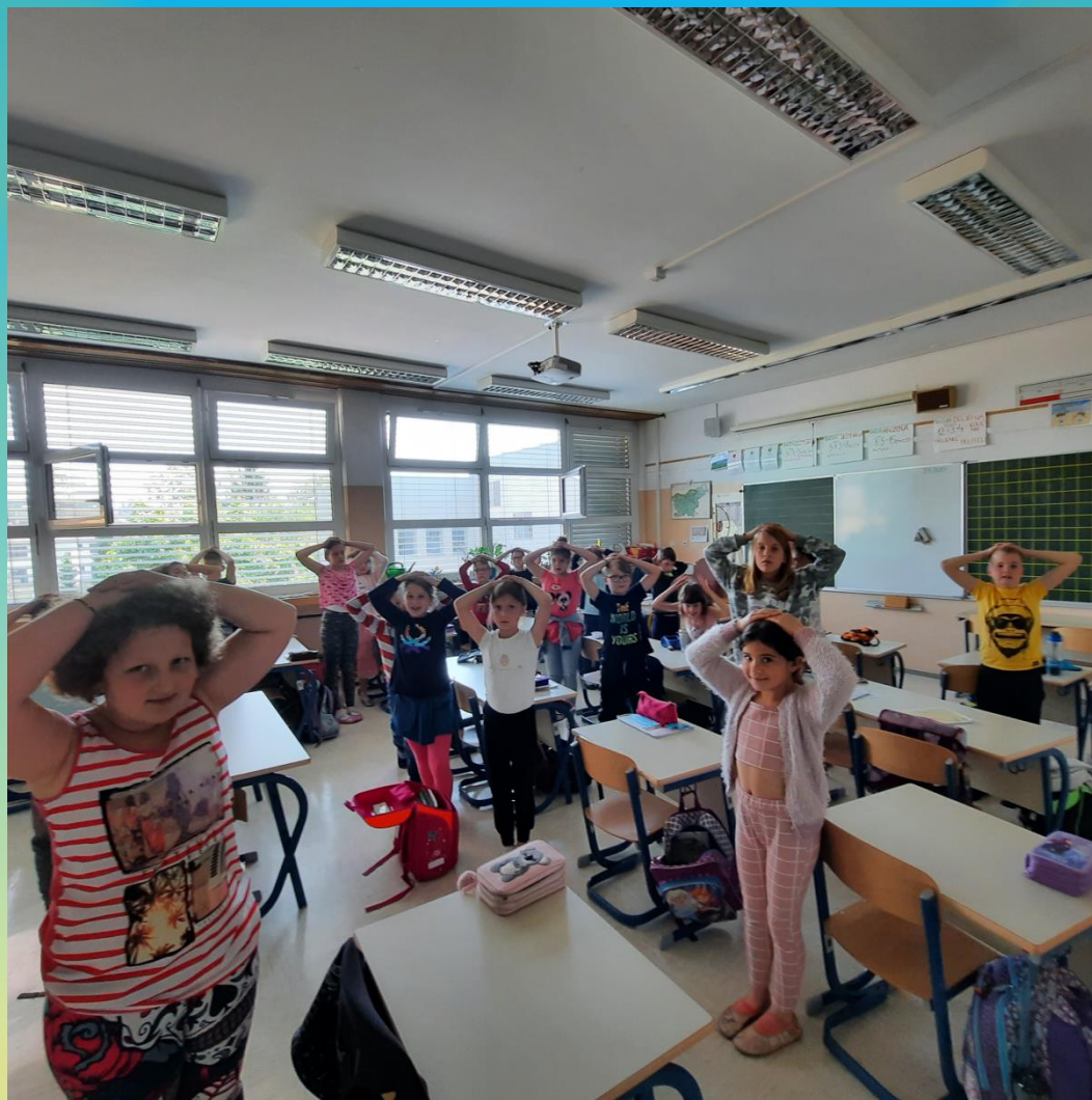
3. b: Minutni gibalni odmor