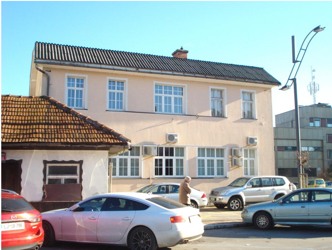
Slika 6: Ravnikarjeva slamnikarska tovarna, v kateri so danes notarske pisarne.