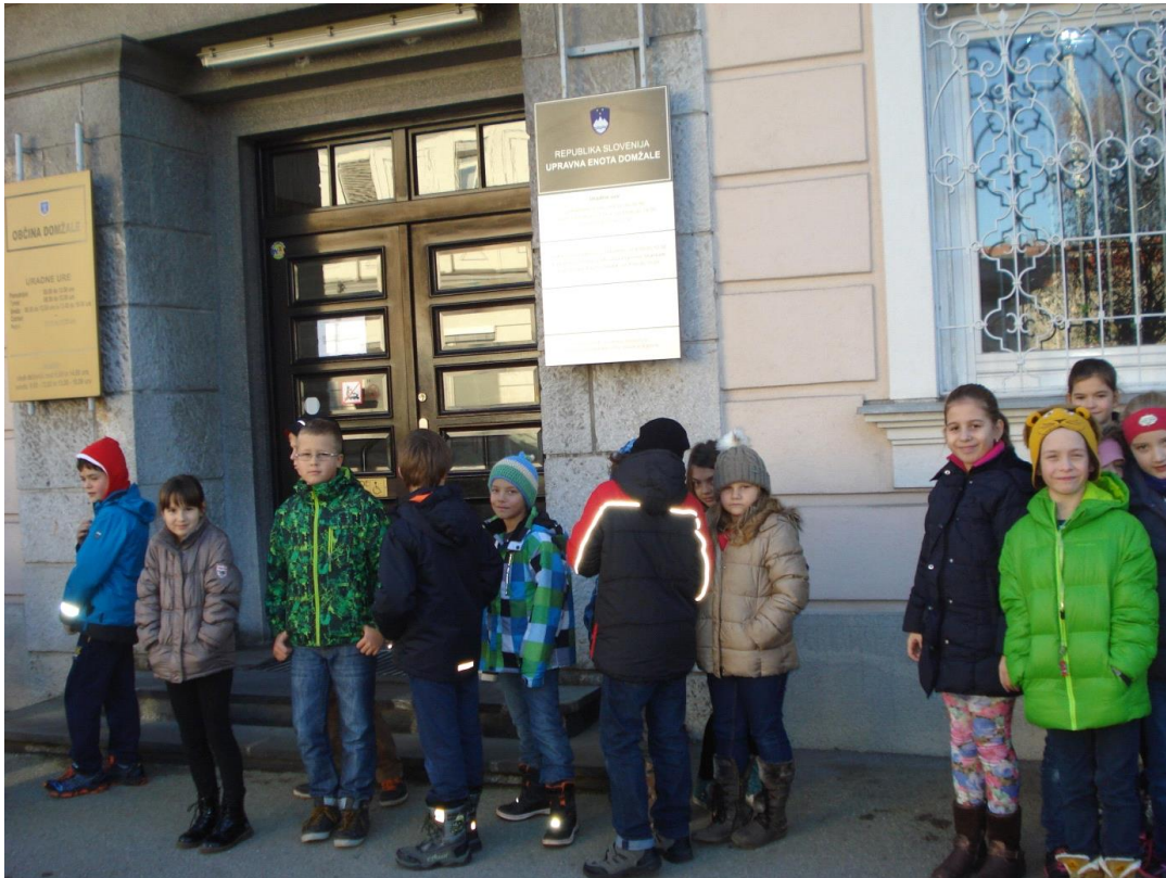
Slika 5: »Nova Fabrika« nekoč slamnikarska tovarna, sedaj v njej domuje Občina Domžale.

Stroje za izdelovanje slamnikov so začeli uporabljati v drugi polovici 19. stoletja. Prvo tovarno je v Študi leta 1857 sezidal Pavel Melittzer. Zgradili so še druge slamnikarske tovarne: Slamnikarska tovarna »Nova Fabrika« je bila zgrajena leta 1874, sedaj ima v njej sedež Občina Domžale; Ravnikarjeva slamnikarska tovarna je bila zgrajena leta 1908, danes so v njej notarske pisarne; Polževa slamnikarska tovarna; Cerarjeva slamnikarska tovarna.