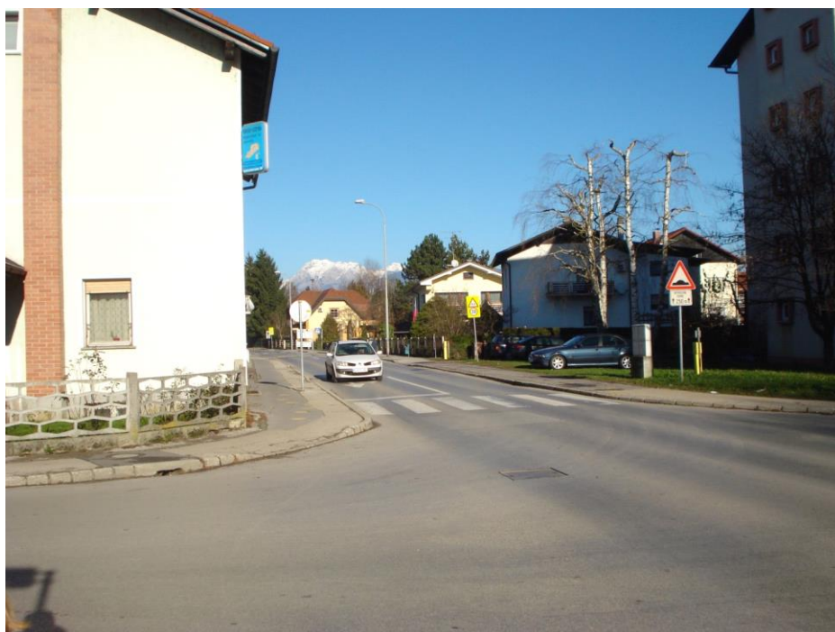
Slika 12: Iz Slamnikarske ulice imamo lep razgled na Kamniške Alpe.