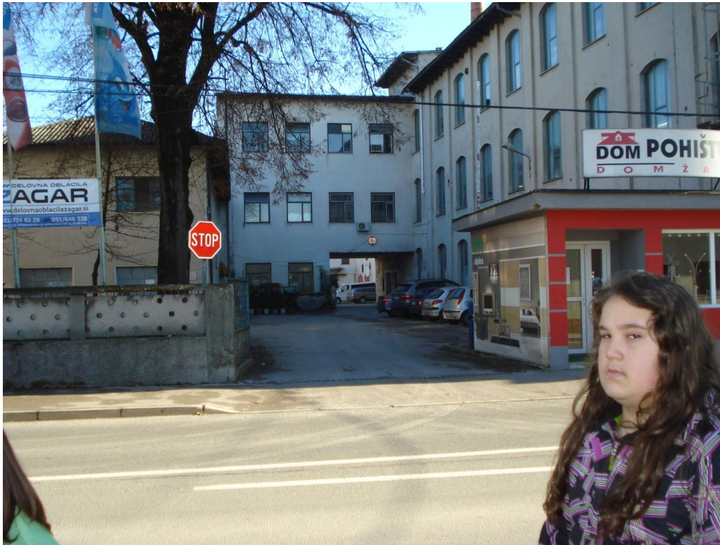
Slika 9: Vhod v nekdanjo tovarno Univerzale.