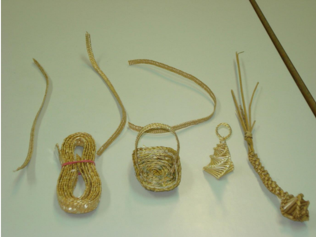
Slika 14: Kite iz slame in izdelki iz slamnatih kit