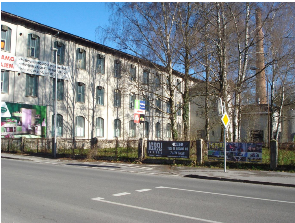
Slika 8: Prazna slamnikarska tovarna Univerzale. Iz strani z plakati dajemo v najem.

Eva je zapisala: »Škoda pa je, da ni več tovarn, ker veliko ljudi nima služb«.