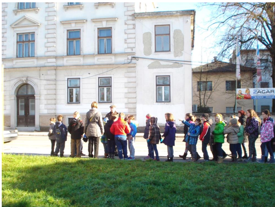
Slika 11: Sprehod po Slamnikarski ulici mimo nekdanje slamnikarske tovarne Univerzale.

Na nekdanj uspešno obrt in mogočno slamnikarsko industrijo spominja Slamnikarska ulic v Domžalah.