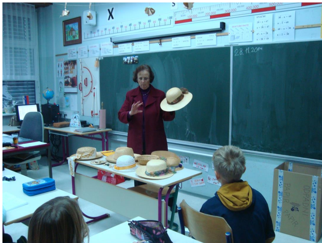
Slika 3: Slamnik iz Kitajske

slamnikov. Nekaj jih je naredila sama, nekaj jih je kupila. En slamnik je bil izdelan na Kitajskem.