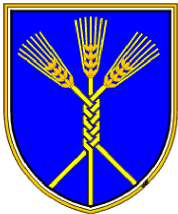
Slika 13: Grb Občine Domžale

Grb je upodobljen na ščitu, na katerem so na modri podlagi upodobljeni trije zlati žitni klasi, ki so med seboj prepleteni v slamnato kito.