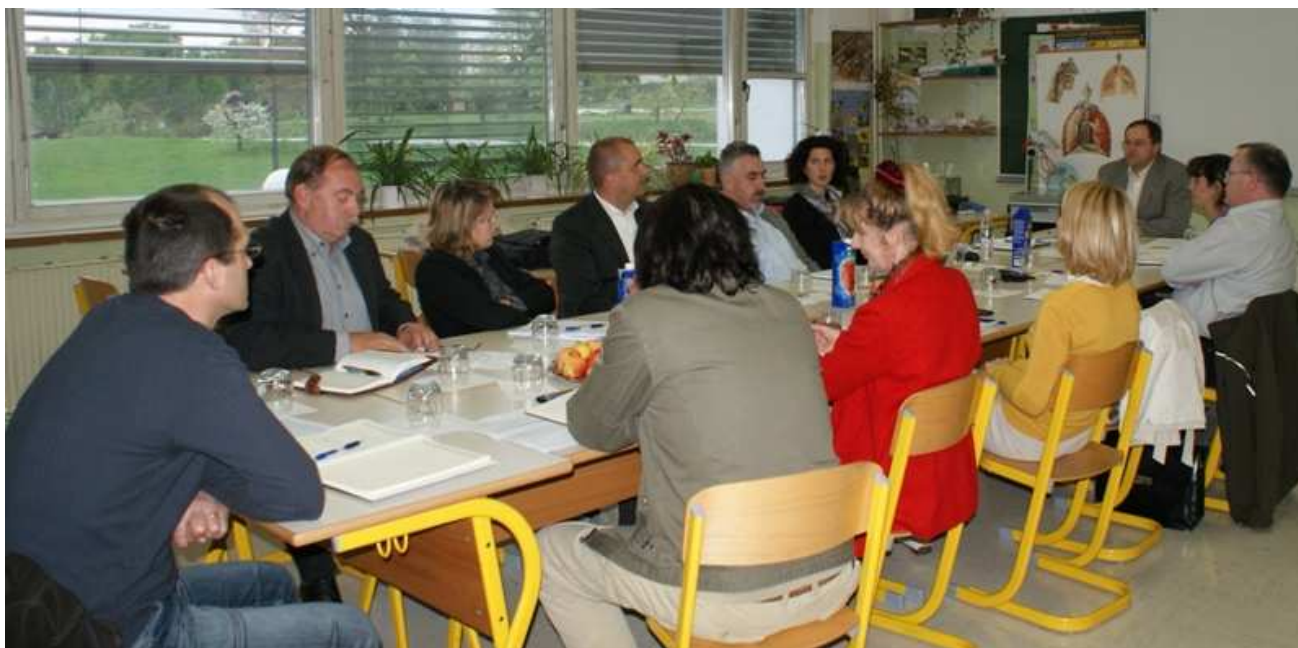
Slika: Koordinacija predsednikov aktivov, Brdo pri Lukovici, 14. april 2011

Dokončno je dozorela tudi ideja o ustanovitvi Zveze. Sklep o začetku postopkov, okvirno časovnico in predvideni datum ustanovitve Zveze je sprejela koordinacija predsednikov aktivov na sestanku na Brdu pri Lukovici, 14. aprila 2011. Stekle so aktivnosti, ki so v dveh mesecih pripeljale do ustanovitve Zveze aktivov svetov staršev Slovenije, 8. junija 2011.