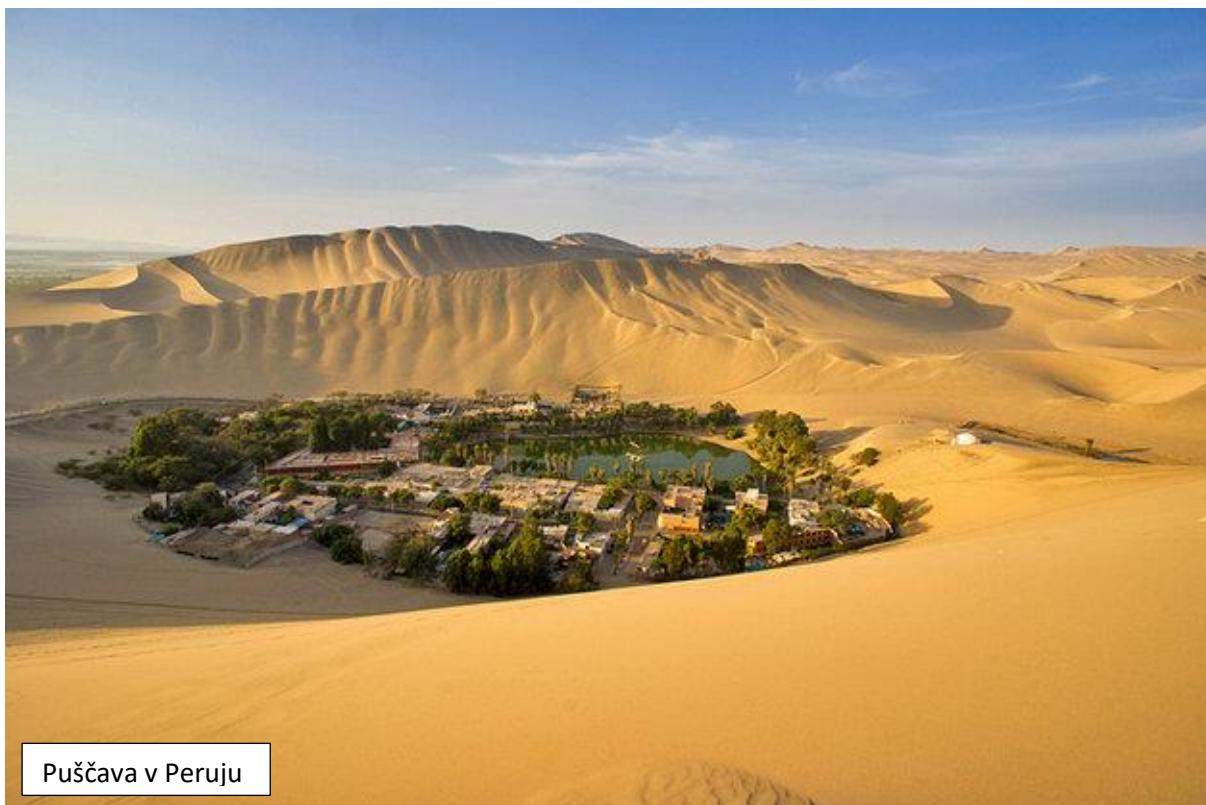
Puščava v Peruju