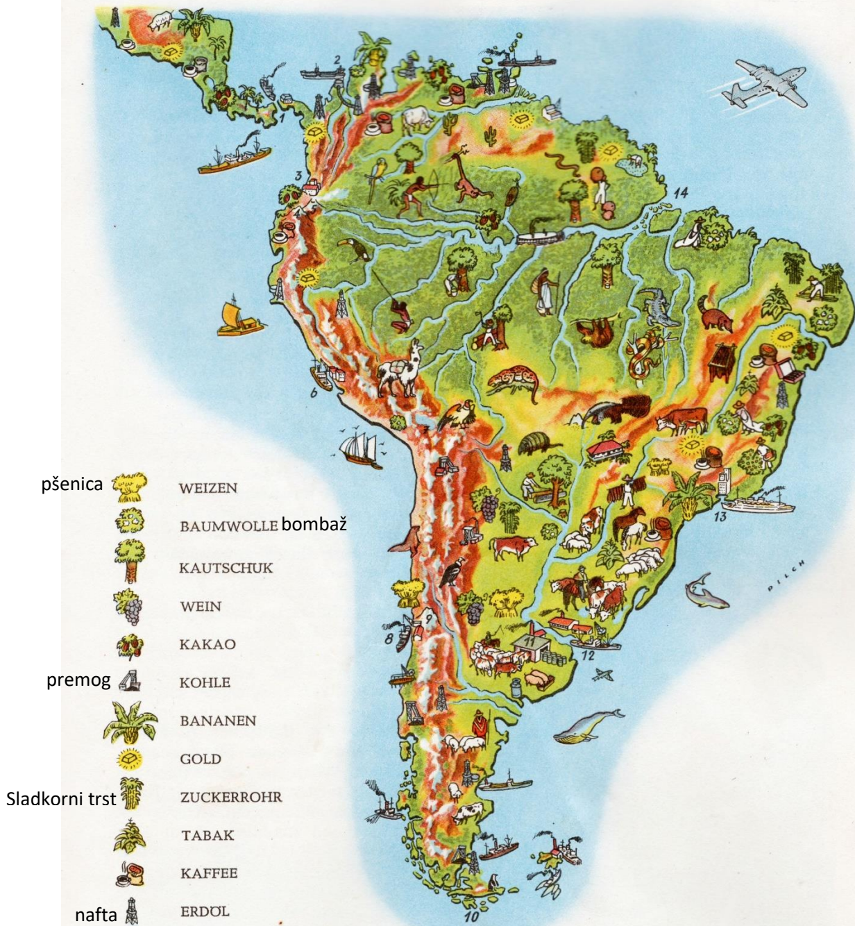
Südamerika: 1) Panamakanal, 2) Cartagena, 3) Quito, 4) Chimborasso [tschimboraso], 5) Cotopaxi [kotopaxi], 6) Lima, 7) Titicacasee, 8) Valparaiso, 9) Aconcagua, 10) Kap Hoorn, 11) Buenos Aires, 12) Montevideo, 13) Rio de Janeiro [schanero], 14) Mündung des Amazonas.