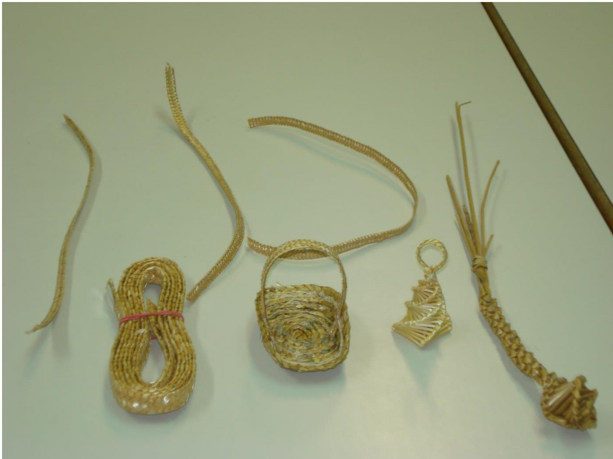
Slika 12: Nekaj naših izdelkov iz slame