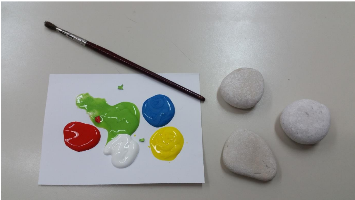
ika 10: Osnovni pripomočki