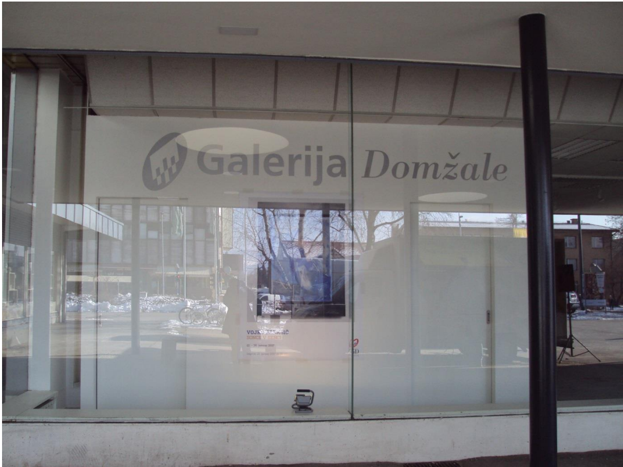
Slika 5: Galerija Domžale

Ugotavljali slikarsko tehniko in slikarkino »najljubšo« barvo, motiv itd. Čas je kar prehitro minil in veselili smo se srečanja s slikarko Vero Terstenjak na naši šoli.