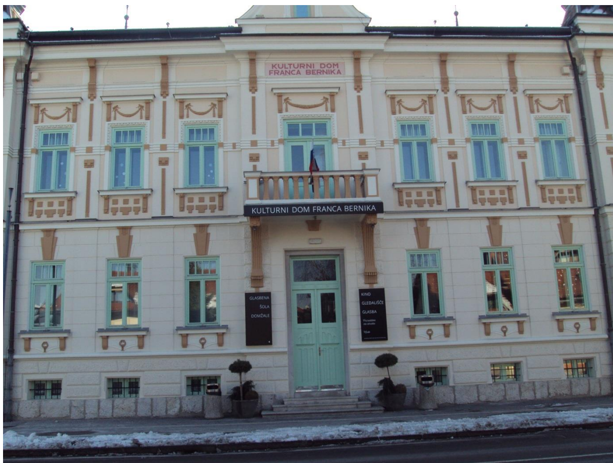
Slika 7: Kulturni dom Franceta Bernika