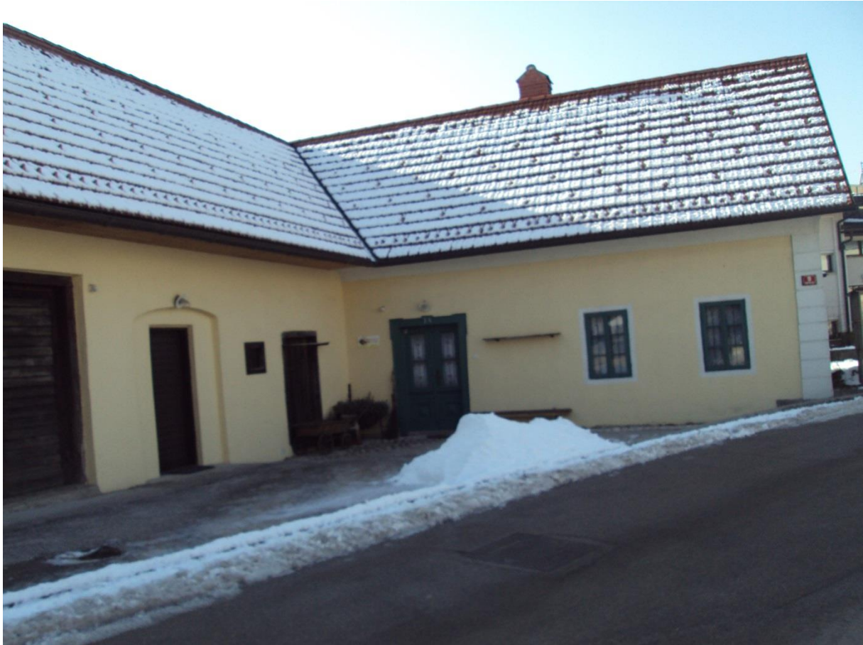
Slika 8: Menačenkova domačija