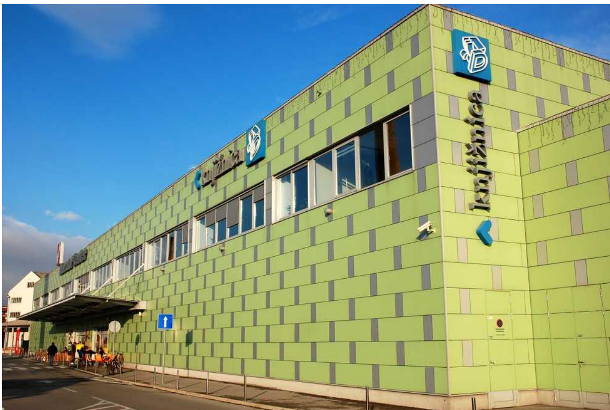
Slika 6: Domžalska Knjižnica