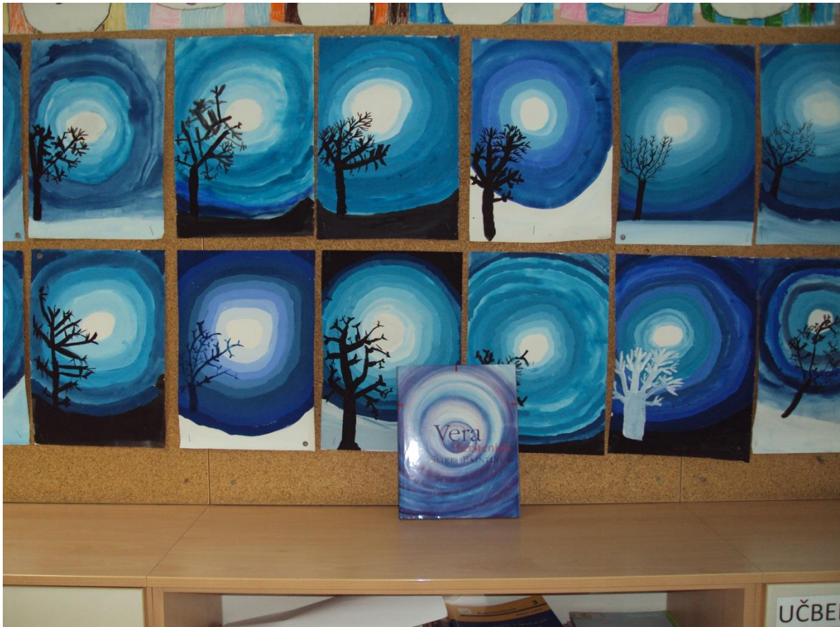
Slika 9: Motiv in vodilo je bila slika K jedru, slikarke Vere Terstenjak.