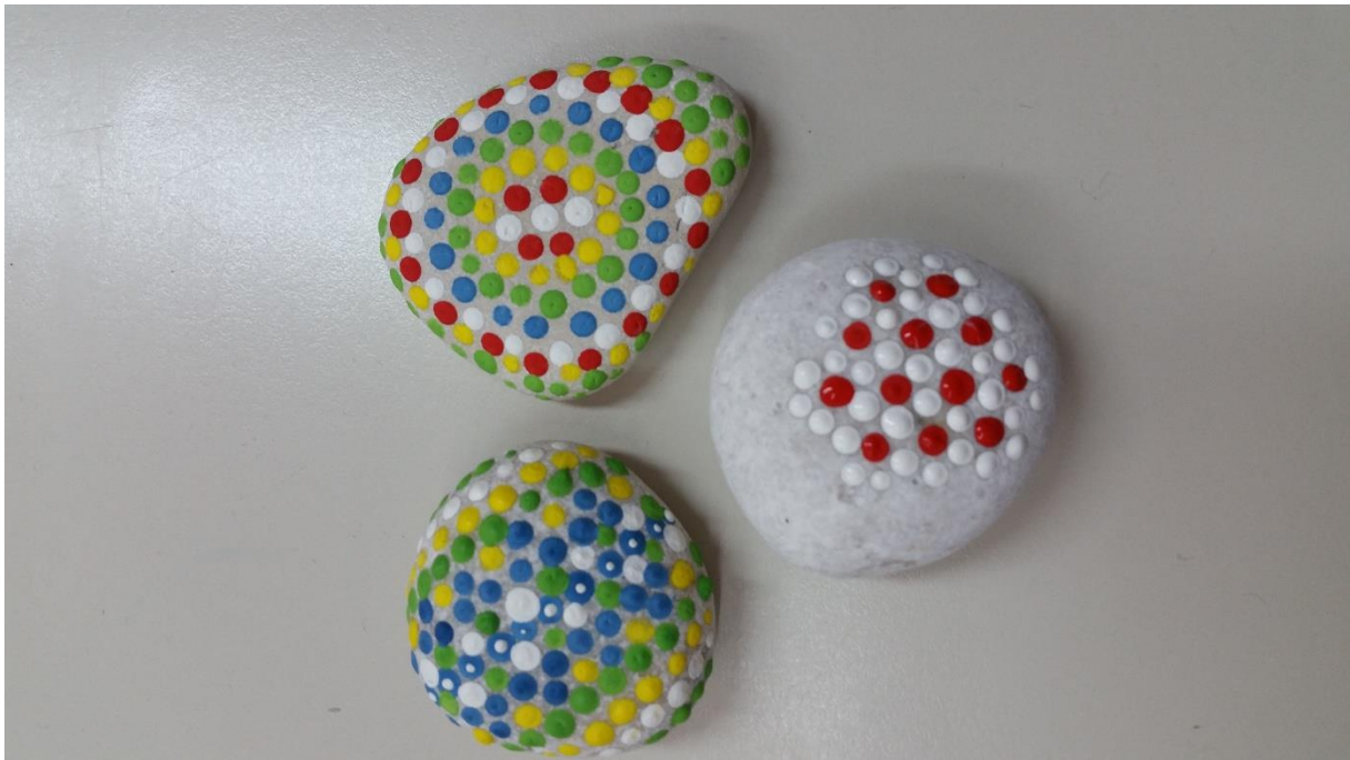
Slika 11: Nekaj kamenčkov za srečo