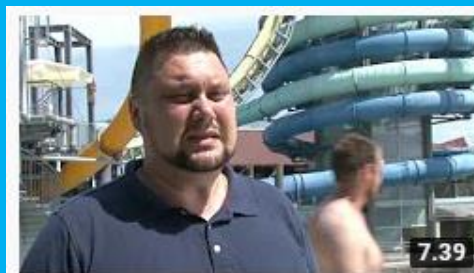
Terme 3000 Moravske Toplice