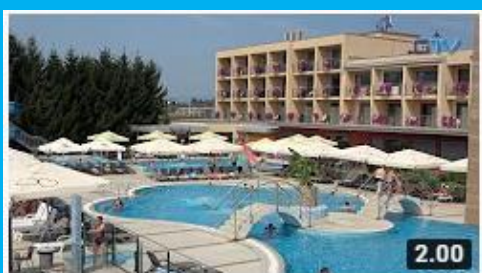
Terme Paradiso Dobova / Brežice