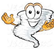
(5n, 5z) TORNADO