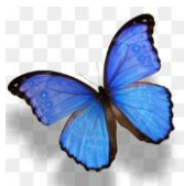
(5 d, 5 g) METULJ