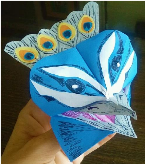
mami od A. O.